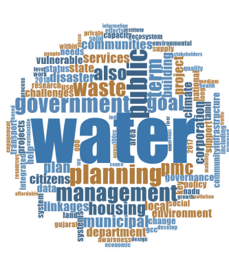
图6 南亚城市韧性策略词云图