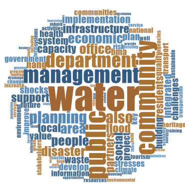
图5 东南亚城市韧性策略词云图