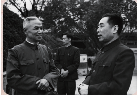
图2 1952年李四光与周恩来总理的合影

(图2),周恩来听后说:“不论工业还是国防,都和地质分不开,地质要先行” [15] 。