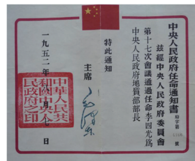
图4 1952年李四光为地质部部长的任命通知书

1952年8月,地质部成立,中央任命李四光为第一届地质部部长(图4)。地委会随即相应撤销,该委员会从1950年8月成立到1952年8月撤销,仅仅2年的时间就完成了过渡时期的任务,比原来设想的3~5年的过渡期缩短了一半。