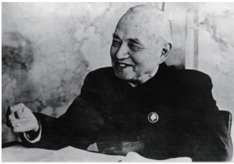
图 5 1971 年 3 月,李四光在办公室部署地热工作

发现有 100 多度热水的情况;1970 年,李四光为毛泽东等中央领导编写了《天文、地质、古生物资料摘要(初稿)》一书,其中对地热资源进行了比较全面的论述;同年,李四光听取北京水文地质一大队汇报北京地区地热普查勘探情况后,指出“地热利用看来是很有前途的,要广范地开展这项工作”;1970 年 10 月 27 日,李四光听到天津打出了地下热水后认为:中国中低温的地下水资源很丰富,应该把重点放在工农业生产和人民生活的广泛利用上。在李四光的倡导和推动下(图 5),地热开发利用在北京、广东、福建、云南、四川等许多省市开展起来。