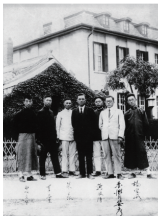
图1 1921—1936年李四光(左4)在北京大学任教

李四光在野外考察时,收集到了煤系地层中许多古生物化石标本,其中以微体古生物化石蜓科样品居多。为了把含煤地层划分清楚,李四光精心研究蜓科化石。他自己动手磨制了大量薄片,用显微镜细心观察,作出精确的鉴定。“蜓”是李四光创造