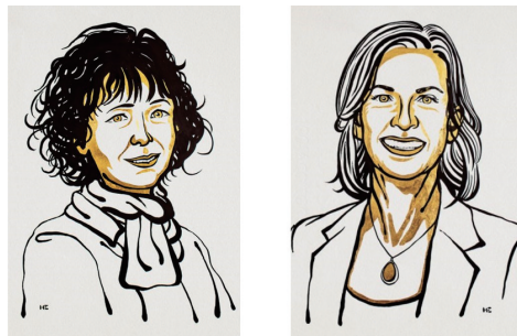
图1 埃马纽埃尔·卡彭蒂耶(左)和珍妮弗·杜德纳(右)

核酸)。这一工具为植物育种带来了新机会,有助于开发新的癌症疗法,并可能使治愈遗传性疾病的梦想成真,为整个生命科学带来了无限的可能。