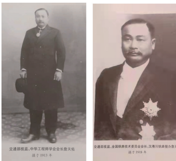
图1 詹天佑

佑的家规家训、爱国情怀和报国图强、为官之道等民族精神与人才思想及其铁路经营方略,无不深受华夏大地中华儿女的传颂。