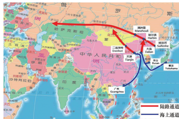
图4 东北亚跨境物流通道示意(据互联网图修改)

境内绥芬河口岸至满洲里口岸段现有交通线路包括国家干线铁路绥满铁路、国家高速公路绥满高速以及国道301等普通干线公路,已实现高速公路、普通干线公路直接连通边境口岸。绥芬河口岸往东通过铁路、公路可连通俄罗斯的符拉迪沃斯托克港,形成国际陆海联运通道——中俄“滨海1号”通道。满洲里口岸往西可通过铁路连通第一亚欧