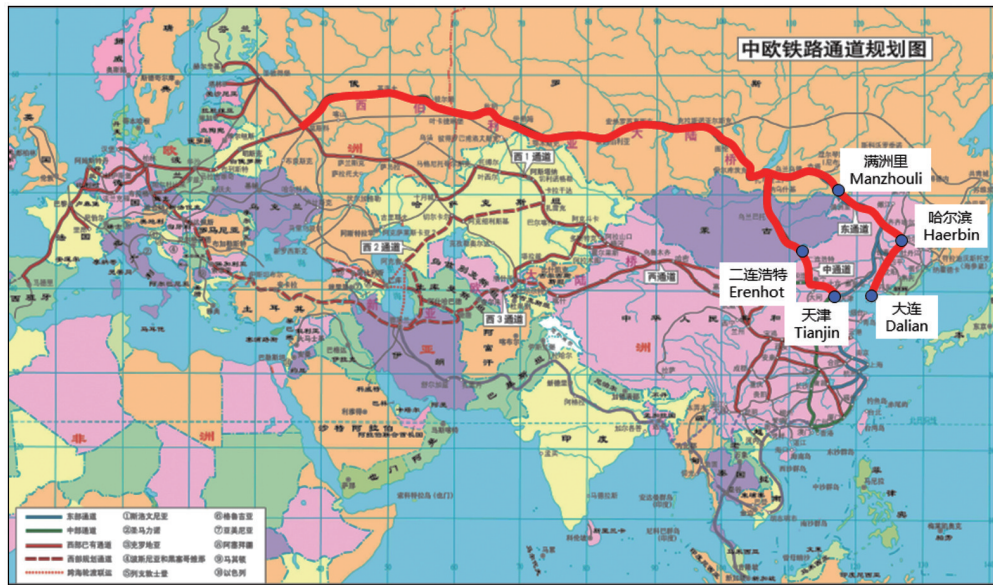
图5 跨境铁路通道示意 (据《中欧班列建设发展规划》图修改)

国际道路运输方面,在已签署的系列双边、多边运输协定的框架下,中蒙俄国际道路运输线路逐步增多。蒙古和俄罗斯分别于1991、1992年与中国签署双边国际道路运输协定,是最早与中国在国际道路运输领域建立合作关系的2个邻国。经过20多年的发展,中蒙、中俄之间已分别开通了21、74条国际道路运输线路。2016年8月,中蒙俄国际道路货运试运行活动在天津港启动,该线路自中国天津港经蒙古国乌兰巴托市至俄罗斯乌兰乌德市,全程约2150 km,历时7天,推动实现了中蒙俄三国间的过境道路运输,为“中蒙俄国际经济合作走廊”建设提供了道路运输服务保障。中国已于2016年7月加入联合国《国际公路运输公约》(TIR),成为该公约第70个缔约国,大大提高了国际道路运输效率,进一步释放中国国际道路运输的潜力。2018年5月,中国首批6个TIR运输试点口岸同时开放接受TIR运输,中俄两国共同开启了从大连到新西伯利亚的中俄国际道路运输新线路试运行活动。2019年6月,中国所有边境口岸均接受TIR运输。