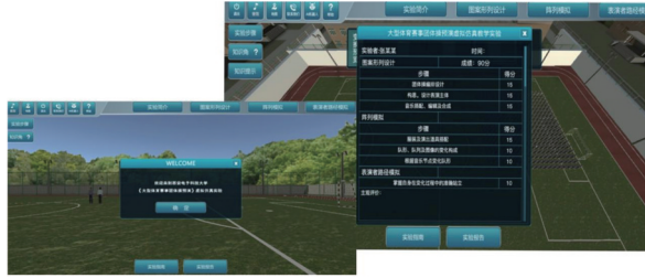
图4 虚拟仿真场景化设计应用开始与结束页面

实验结束时完成实验并提交,教师评级以及学生之间根据系统给出的考核标准进行互评,开始与结束页面如图4所示。