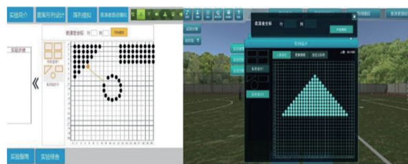
(a) 软件应用设计原型

表演队形及图案创编是软件的核心模块,该模块分为:(1)表演风格及难易程度的选择;(2)主题策划动作的创编;(3)队形及路线的编排。具体软件操作原型图及模拟效果如图3所示。