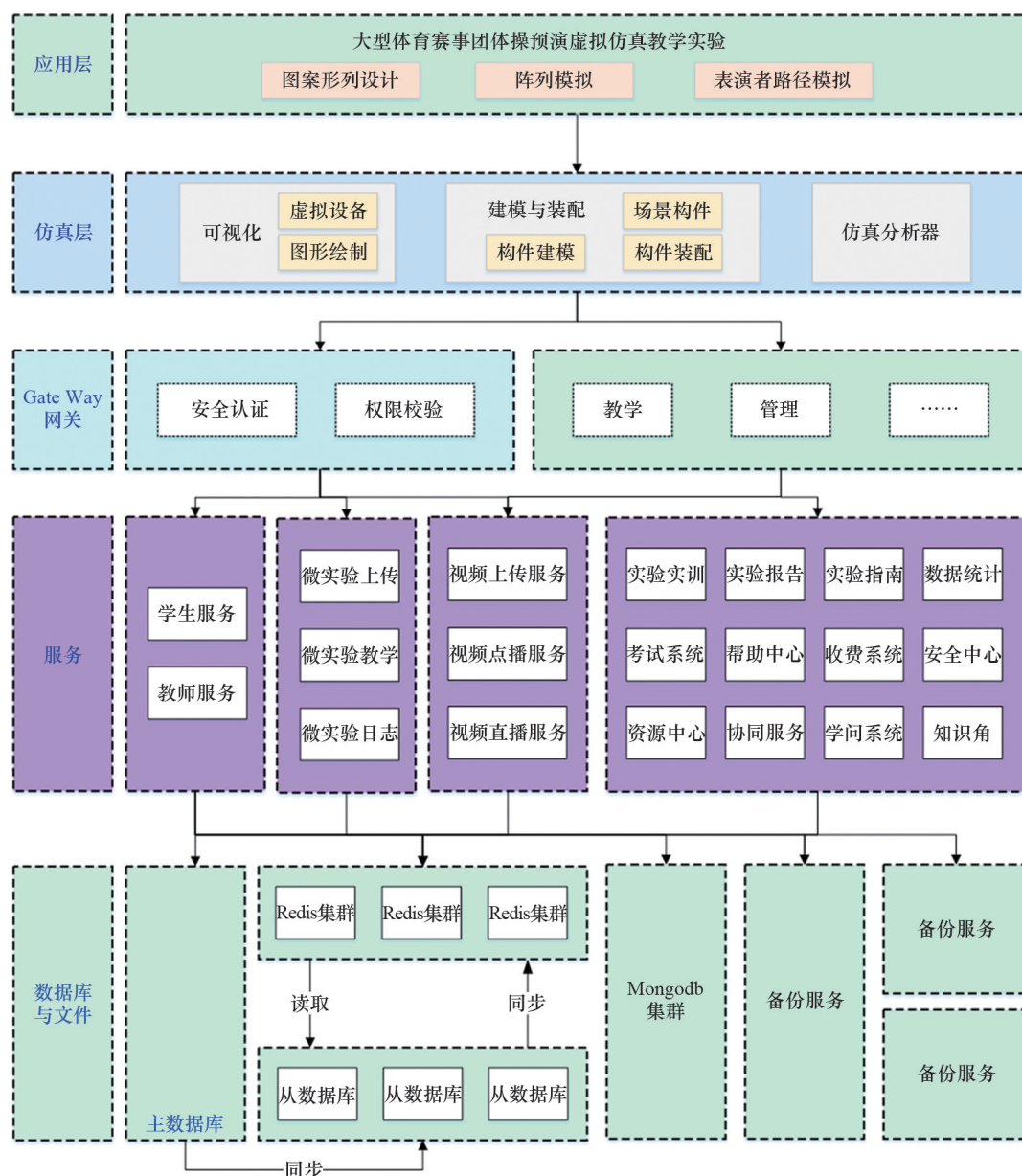
图 1 虚拟仿真实验流程架构

该系统是基于 B/S 架构设计的虚拟仿真实验教学平台。针对大规模开发要求,系统采用轻量化的开发语言和模块化设计方案,部署简单、使用方便,实验流程架构如图 1 所示。系统支持分布式部署方案,可随使用情况动态扩充容量,基于容器化部署还可实现自动扩容,无需人为干预。系统包含实验实训、实验报告、实验指南、数据统计、考试系统、帮助中心、收费系统、安全中心、资源中心、协同