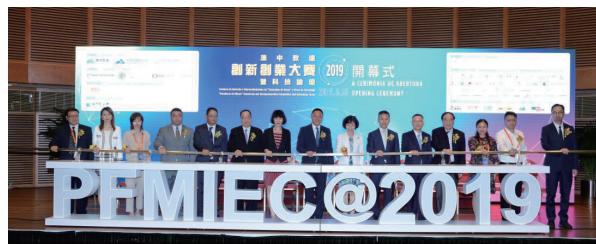
图1 2019年6月18日“澳中致远”创新创业大赛在澳门科学馆会议中心举行

2019年举办的澳中致远创新创业大赛(图1),获国家教育部、科学技术部、内地著名孵化机构和企业支持,打造成一条直通国家科学技术