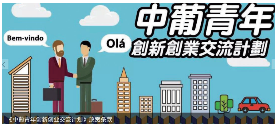
图2 “中葡青年创业交流计划”放宽参加条件

2018年10月,澳门青年创业孵化中心获国家科学技术部授牌,成为港澳地区首个“国家级备案众创空间”,肯定了其在推动双创事业的努力及成果。