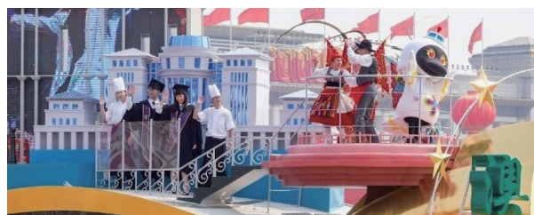
图3 澳门大学模型出现在2019年 国庆游行的彩车上

校区运作。在2019年国庆天安门游行时,澳门的彩车上有澳门大学新校区建筑的模型,凸显了回归后澳门特别行政区政府对高等教育和科学研究的重视(图3)。