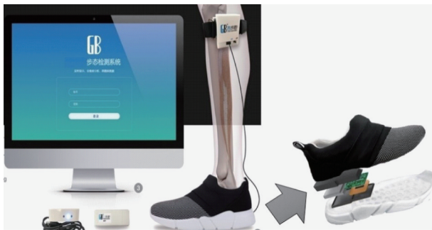
图2 可穿戴步态采集设备与步态分析系统

设备常以鞋或鞋垫的形式,嵌入整合了压力传感器、曲度传感器、加速度计、陀螺仪和惯性传感器等电子元器件的模块来实时高精度地采集受试者步态信息,包括步态的时空与动力学特征 [12] 。配合穿戴于肢体和躯干的整合角度计模块,与足部信息结合可以得出下肢与躯干的运动动态角度信息,可以提供全面的个体步态信息。可穿戴步态采集系统与其他系统相比,除具有实时性与高精度外,在应用方面具有成本低廉、操作简单、患者配合度和采集环境要求低等优势,并使日常步态的采集与检测成为可能,具有广阔的医疗康复与养老监护领域应用前景。