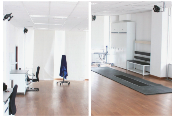
(a) 设置于步态实验室内各角度的影像捕捉设备 (b) 受试者行走压力垫表面的影像捕捉设备

分为基于影像和基于传感器的两大类。基于影像的步态采集设备应用最广泛的是立体视觉技术 [8] ,该技术主要区别于单目视觉采集系统,利用摄像头组获得目标的不同角度上的影像信息,通过视觉图像处理得到深度等信息(图1(a))。利用该技术的三维步态采集系统成本高昂,通常需要较大的空间,同时要求精准的拍摄角度和靶标位置,环境中的任何遮挡和干扰光点都会影响采集结果,临床实际操作过程较为复杂,要求患者配合度高,同时涉及多个产生误差的环节。其他基于影像的步态采集技术还包括飞行时间的红外相机 [9] 和红外热成像法 [10] 等。