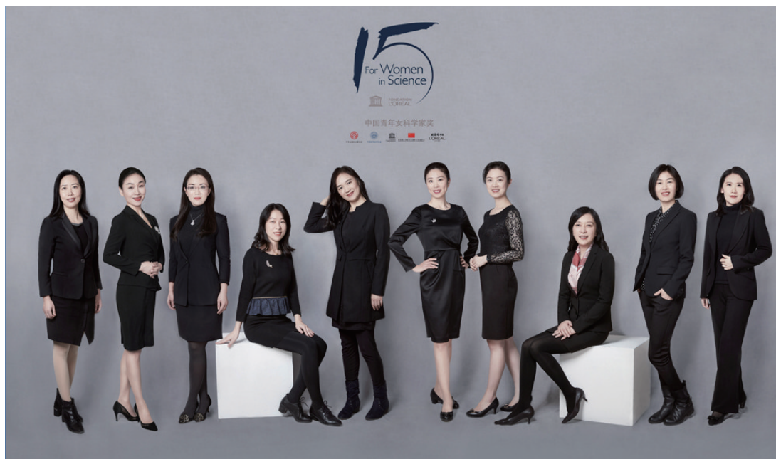
图1 第十五届“中国青年女科学家奖”获得者合影

4月29日,由中华全国妇女联合会、中国科学技术协会、中国联合国教科文组织全国委员会及欧莱雅中国共同举办的第十五届“中国青年女科学家奖”颁奖典礼在北