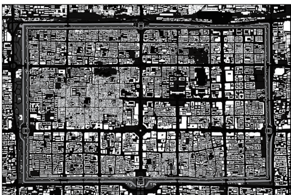
图1 西安明城区现状

西安明城区是历史片区的典型代表,同样经历过大规模的“建设性破坏”,而保护观念滞后造成的“保护性破坏”更不容忽视,突出表现为“存此不存彼”的风貌式保护、“见屋不见境”的孤岛式保护、“见物不见人”的标本式保护(图1)。