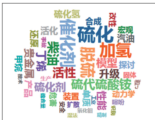
图2 基于词云图谱的“零被引专利”影响的研究主题分布

如图2所示,“零被引专利”影响到的研究主题,包括硫化、催化剂、加氢、脱硫、柴油、硫代硫酸铵、硫化剂、甲烷、丁烯、硫含量、氧化钼、噻吩、硫化氢等。