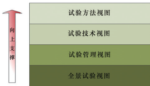
图2 试验标准体系多视图参考模型

参照多视图体系结构建模思想,结合试验标准体系的特点,综合分析标准体系的一般划分方法,可以从试验全景视图、试验技术视图、试验管理视图和试验方法视图等角度对试验标准体系进行分析,参考模型如图2所示。