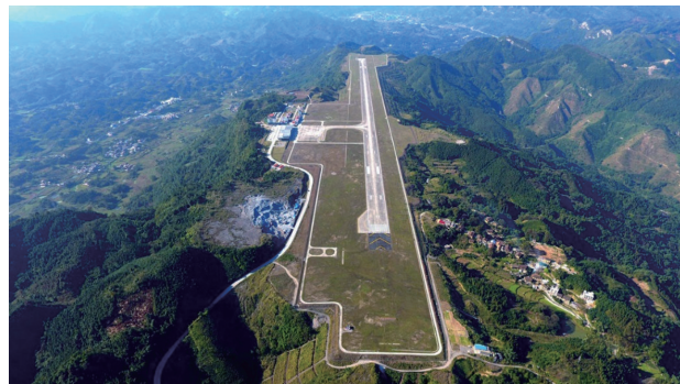
图1 “削山平谷”建造的广西河池高填方机场 Fig. 1 Hechi high filling airport in Guangxi Province by "cutting the mountains to fill the valleys"

高填方机场, 是通过“削山平谷”方式建造的机场, 即将山头的土石搬运填筑到山谷以此形成一个开阔的机场平面(图1)。而由于山峰山谷间的巨大落差, 加上