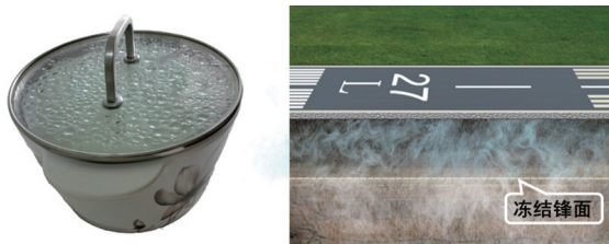
图4 “锅盖效应”下的水气迁移

研究组又经过反复地探索与试验 [11-12] ,发现在冻结锋面(图4)以下铺设隔气层堵住水汽上移,再对这部分水汽进行疏导,如此一来,隔气层以上土层的含水量不会再增加,对土体性能的影响也就微乎其微;而隔气层以下土层中的水气由于温度条件不足无法产生锅盖效应。通过这种疏堵结合方法,有效地防治这种由冷凝或凝华产生的锅盖效应。为了验证这一方法的切实有效性,研究组还在机场做了现场对比试验,结果与预期吻合。至此,可以更加科学地解释20多年前兰州机场和敦煌机场的病害原因,同时切中要害地提出简单易行的解决方案并应用到机场的工程建造中。