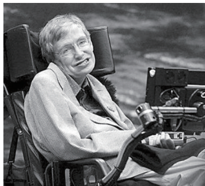
图1 斯蒂芬·威廉·霍金(1942—2018)

霍金无论是在学术贡献上,还是在科学普及和科学文化传播上,都配得上当今一位伟大物理学家的称号。斯人已逝,他所创造的物理理论,发表的学术工