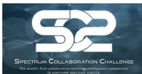
图3 频谱协作挑战赛会标

当前,新型军民用无线设备不断涌现并抢占无线电频谱资源,造成无线电频谱空间日益拥挤和紧张。为解决这一现实问题,DARPA在2016年度拉斯维加斯国际无线通信展(IWCE)上宣布将举办频谱协作挑战赛(图3) [27] ,目标是通过鼓励和资助参赛团队设计开发能有效协作运行的无线电设备和系统,确保其能够充分使用电磁频谱。频谱协作挑战赛计划分3个阶段实施,于2019年底结束,决赛前3名的奖金分别为200万美元、100万美元和75万美元 [28] 。