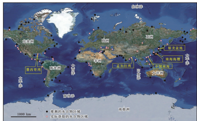
图1 当前天然气水合物勘探热点区域示意

湾、韩国郁龙盆地、印度孟加拉湾、日本南海海槽、中国南海北部等海域(图1), 取得了积极进展, 2017年6月25—30日, 在美国科罗拉多州丹佛市召开的第九届