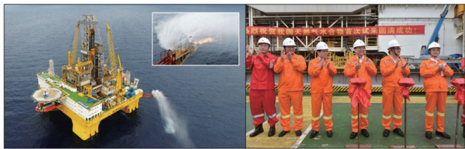
图4 南海神狐海域天然气水合物成功试采

备的自主创新,实现了历史性突破。”“海域天然气水合物试采成功只是万里长征迈出的关键一步,后续任务依然艰巨繁重。” [11]