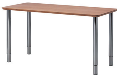
图3 理科、工科、文科、艺术支撑“设计”示意

理科旨在发现并解释真理,工科重在发展解构、建构的技术,文科是非与道德的判断,艺术着力于品鉴自然、人生、社会的途径,这4个学科是人类进步的支柱。而这4个支柱撑起的、人类为之共同生存的“工作面”就是“设计”——整合了上述所有因素,去创造人类更健康更合理的生存方式(图3)。