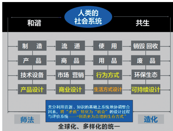
图1 人类的社会系统示意

“共生”、包容、共享、共赢局面就必须学会在“协商、协调”诸多利益“关系”的过程中发展,这是社会进步的唯一路径。