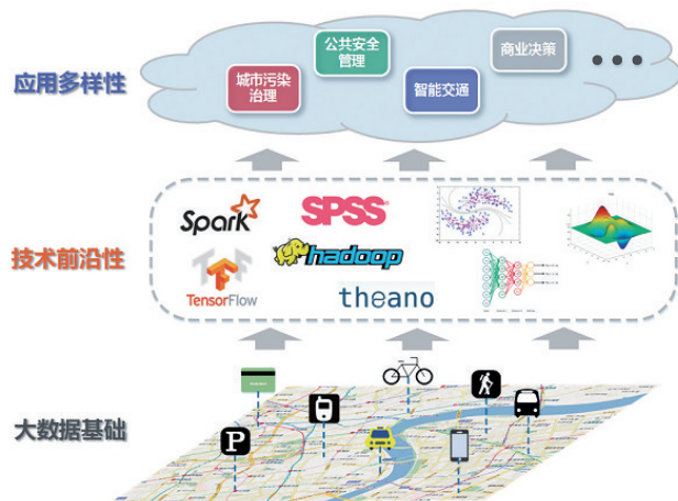
图4 轨迹预测框架 [15]