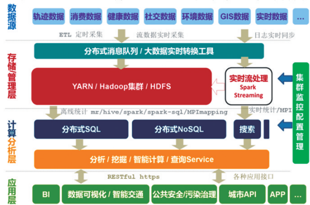
图3 大数据驱动的智慧城市技术框架

本技术框架的总体思路:采用目前先进的分布式并行计算模式 Lambda 混合架构,即同时进行历史数据批处理和实时数据处理的混搭模式。实时数据进入一个流处理系统进行检测分析,同时也进入 Hadoop 集群,全量数据放在 Hadoop