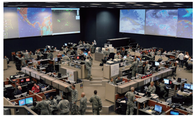
图1 第12空军联合空中作战中心 Fig. 1 The 12th Air Force Combined Air Operations Center (CAOC)

分布式打击将变得越来越重要,武器现代化的加速为作战提供新的力量和能力。美国海军舰队已开始配置定向能武器。负责海军作战概念实施的马纳泽尔认为,定向能武器