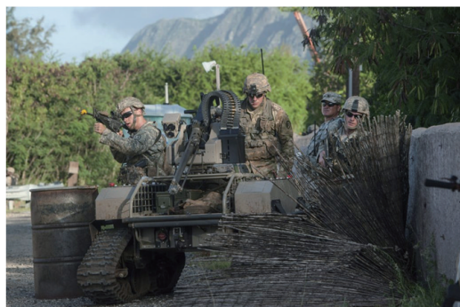
图4 在夏威夷,一名士兵控制着携带机枪的机器人 Fig. 4 A soldier mans a robot-carried machinegun in Hawaii

洛克希德·马丁公司极其重视分域战概念,2017年4月举行了一系列保密级作战推演,以探索反介入/区域拒止(A2/AD)的作战战略、战术和武器的概念。“多域战”的方法主要是搜集海洋、陆地和空天信息,汇集在一起,以难以置信的速度进行分析,然后决定采用机器和人的最佳优化组合方式,对目标进行攻击(图4)。