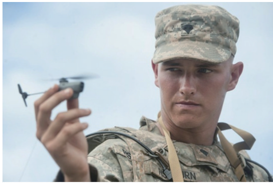
图2 PD-100微型无人机 Fig. 2 PD-100 mini-drone