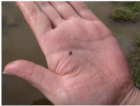
图2 分布于3500 m以上的一种豆蚬 Fig. 2 A unknown bivalve species, Pisidium sp., distributed in altitude over 3500 m

大型水生植物常见类群包括3类:轮藻,兰藻,水生维管束植物。轮藻中的丽藻( Nitella sp.)、鸟巢藻( Tolypella sp.)、西藏鸟巢藻( Tolypella Xizang )、轮藻( Chara sp.)等主要分布在温泉、沼泽及微咸水湖泊-低盐度盐湖区域。蓝藻中的念珠藻( Nostoc sp.)多分布于4℃左右低温泉水处。水生维管束植物中的芦苇( Phragmites communis )、小叶蓼( Polygonum minus )、黑三棱( Sparganium stoloniferun )和节节草( Equisetum ramosissimum )分布广,湖泊河口区多见,但资源量有限;茵齿眼子菜( Potamogeton pectinatus )多分布于河流;而未知种眼子菜( Potamogeton sp.)仅分布在若干湖泊,但资源量可观(见后文)。