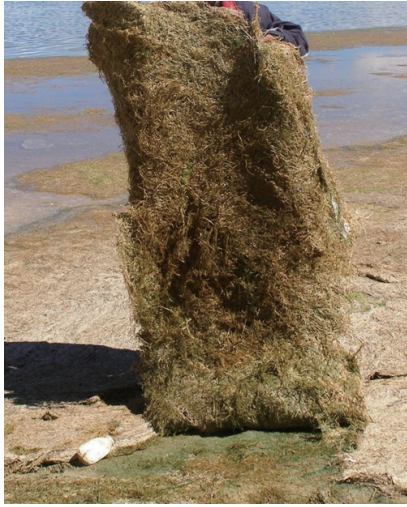
图4 西藏崩则错湖岸上由风浪夹带上岸的眼子菜形成的草垫 Fig. 4 Potamogeton mats formed by winds and waves on the Tibet Bengze Co shore

卤虫是盐湖中的珍贵生物资源。在西藏,共发现有卤虫分布的盐湖大小34处,其中资源规模值得开发的盐湖有16处。卤虫是高盐水体中特有的生物物种,卤虫卵堪称盐湖软黄金。20世纪50—80年代,由于卤虫卵的几次歉收,导致全球水产业数遭萧条,南亚各世界水产大国的养殖场纷纷倒闭。即使今天,卤虫卵在水产养殖中所起到的作用也无法用饲料完全取代。