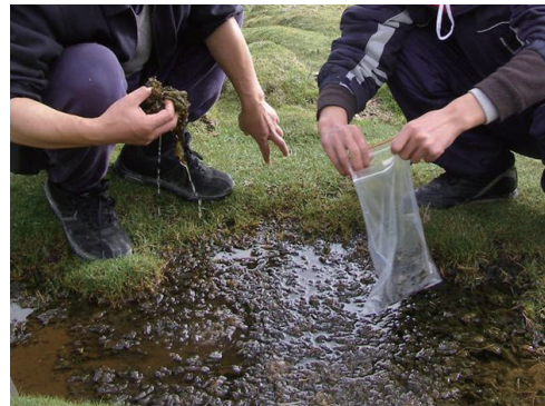
图3 西藏“水木耳”念珠藻 Fig.3 "Water agaric" Nostoc in Tibet

藏北高海拔区的一种念珠藻( Nostoc sp.,简称水木耳)具有未来产业前景。念珠藻分布于低温泉水区,局部生物量可达4 kg/m 2 以上,如图3所示。品尝口感类似于天然木耳,味道鲜美,并且维生素B6、B12含量远高于后者,特别是硒(Se)的含量达到0.84 mg/kg干物质,面对众多硒需求人群,念珠藻是一个具有产业化前景的物种。