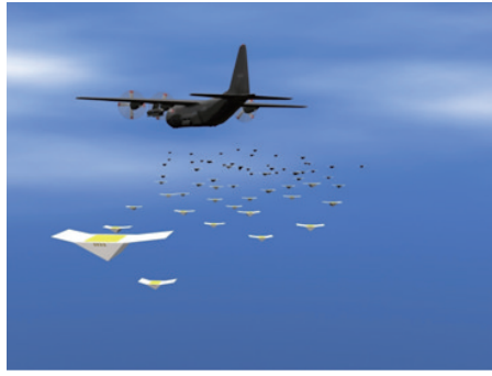
图2 “蝉”微型无人机投放过程构想 Fig. 2 Imagination of drop of Cicada Nano UAVs

无人机集群除了在军事领域的用途外,在民用方面也可用于遥感遥测、地质勘探、应急救援、气象探测、空中分层网络、精确农业和商业娱乐等方面,图5为2016年6月新加坡国立大学陈本美教授的无人机团队在福州闽江边举办大型灯光秀表演场景,16架无