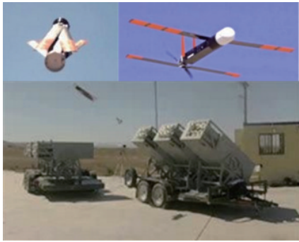
图1 “郊狼”无人机发射过程 Fig. 1 Launch of Coyote drone

低、结构简单、噪声小等特点,可配备多种轻型传感器,执行多种任务。美国海军希望未来可实现在 30 min 内在 17.5 km 投放千架“蝉”微型无人机,覆盖近 5000 km 2 的区域,进行对敌探测和电磁干扰,图2展示了“蝉”微型无人机的投放过程的构想。