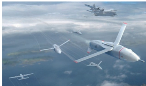
图3 “小精灵”无人机集群发射概念图 Fig. 3 Conception of launch of the Gremlin UAV swarm

此外,无人机集群协作还可以被设想用于建筑领域,文献[5]介绍了瑞士苏黎世联邦理工大学Raffaello的无人机团队采用多架四旋翼无人机自主协同建造由1500块泡沫砖块组成的高达6 m的塔式建筑的系统设计与开发过