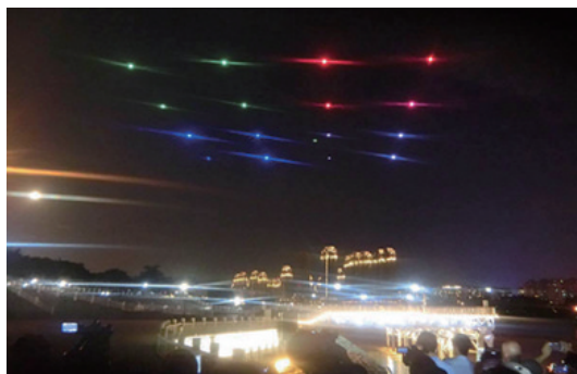
图5 无人机集群的灯光秀表演 Fig. 5 Light show performed by UAV swarms