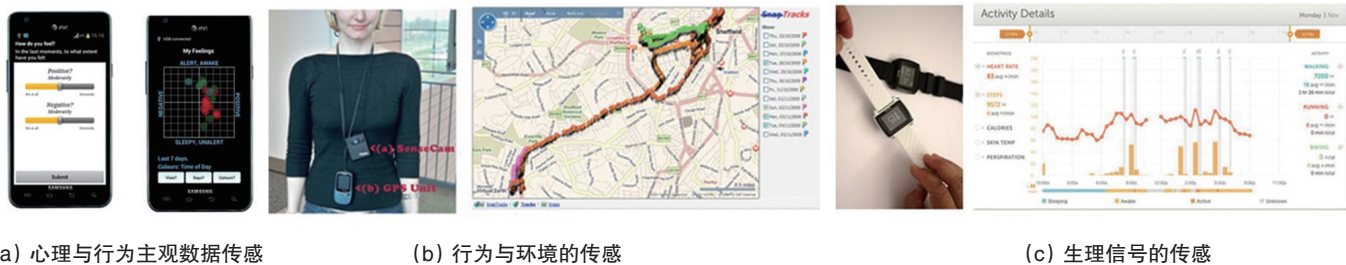
图3 面向日常生活情境心理学研究的移动传感关键技术

移动传感设备所获取的行为与环境信息和生理信号,同样可以通过移动互联网实时传输到数据存储服务器,方便科研人员远程监控研究进展。这些来自物理传感器的客观数据与来自应用程序“传感”的心理与行为状态的主观报告数据相结合,可以实现对人们日常生活情境下心理和行为规律的全面、有效描述。图3中展示了部分移动传感技术运用于心理学研究数据采集过程的案例。图3(a)中左图为EmotionSense的情绪报告界面,右图为一周中的情绪报告得分显示界面;图3(b)中左图任务所佩戴的为SenseCam可穿戴数码相机和GPS位置追踪仪,右图为其所记录的佩戴者一天活动位置轨迹以及固定时间间隔所采集的图片信息;图3(c)中左图为Basis腕表,右图为其所采集的一天中生理活动信息,包括心率、皮电、皮肤温度、行走步数和能量消耗。