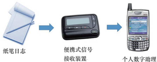
图2 日常生活情境心理学研究技术方法的变迁

记录的形式,在特定的时间、地点或事件情境下,根据研究要求自主完成相应的问卷或量表,报告自己的心理、行为或环境等状态信息。研究者对纸笔日志数据进行人工整理后,开展定性或定量分析,以回答研究问题(图2)。