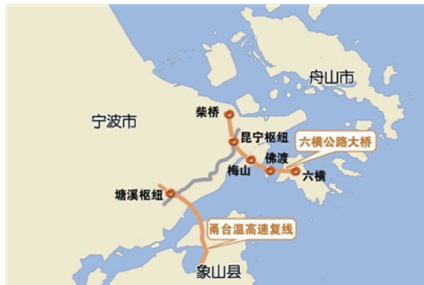
图5 六横公路大桥

2009年1月,江南大桥建成;2011年实现岱山本岛至牛轭岛四岛相连;2014年,岱山连岛第一跨官山大桥建成,这也是岱山建设的首座大型的钢箱梁悬索桥。而第二跨,就是正在施工中的秀山大桥。秀山大桥全长3063 m,主桥为跨径926 m双塔钢箱梁悬索桥,秀山侧引桥为连续梁桥,跨径布置为680 m,按双向四车道一级公路标准设计,路基宽度24.5 m。采用钢箱梁悬索桥为主、预应力砼连续钢构为辅结构,估算总投资23.98亿元 [7] 。承建方认为秀山大桥是东海乃至全国同类型桥梁中,施工难度最大的一座。海水流速快、海底无覆盖层是桩基施工中遇到的两大拦路虎。经过测量,这块海域的海水最大流速为4 m,过快的水流量年冲刷海底的淤泥等覆盖物,使得桩基施工只能直面光秃秃的海底。这在全国范