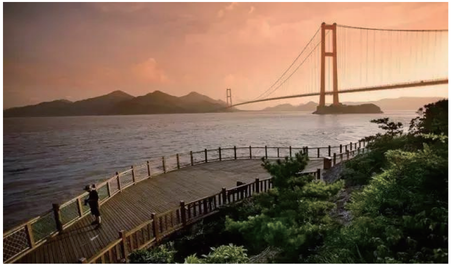
图2 西堠门大桥

金塘大桥是整个大陆连岛工程中投资最大、跨度最长的一座大桥,也是目前世界上恶劣外海环境中建造的最大跨度斜拉桥,有“外海第一跨”之称