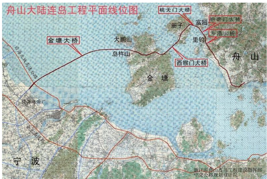
图 1 舟山大陆连岛工程平面线位图

舟山大陆连岛工程始于舟山本岛, 途经里钓、富翅、册子、金塘四岛, 跨越 5 个水道和灰鳖洋, 至宁波镇海登陆, 与宁波绕城高速公路和杭州湾大桥相连接(图 1)。工程全长约 50 km, 由岑港大桥、响礁门大桥、桃天门大桥、西堠门大桥、金塘大桥 5 座跨海大桥及接线公路组成, 总投资约 130 亿元, 是中国规模最大的岛陆联络工程, 也是舟山历史上规模最大、最具社会影响力的交通基础设施项目。工程建设过程中, 其技术难度之高、规模之大, 创造了多项国际、国内之最。