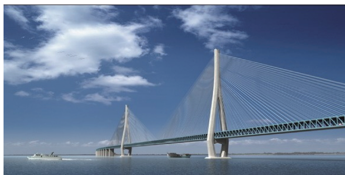
(d) 中国的沪通长江大桥