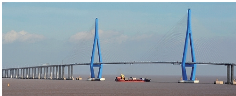
(d) 浙江舟山金塘大桥