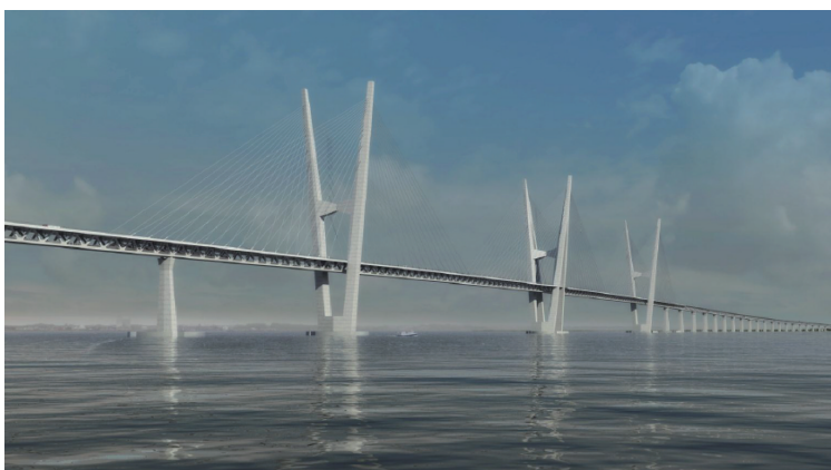
(a) 德国至丹麦的费马恩海峡大桥