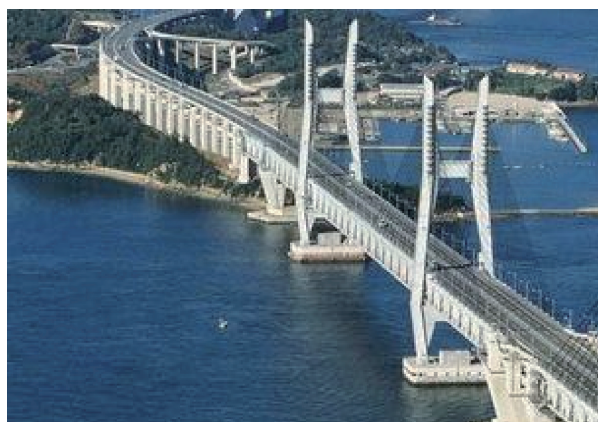
(b) 日本的柜石岛跨海大桥