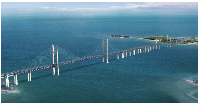
(c) 中国的平潭海峡大桥