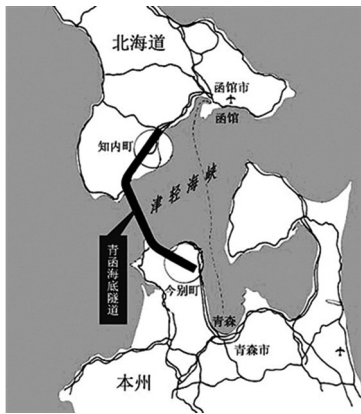
图7 青函隧道位置示意