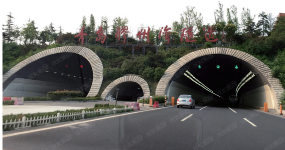
图21 青岛胶州湾海底隧道实景

该隧道连接厦门本岛和翔安区,兼具公路和城市道路双重功能。隧道两端为厦门岛东部的五通码头和同安刘五店,2005年9月开工建设,2010年4月26日开通运营。总投资32.8亿元,全长8695 m,其中海底隧道长6050 m,跨越海域宽约4200 m,设计行车速度80 km/h。设计采用三孔隧道方案,两侧为行车主洞各设置3车道,中孔为服务隧道(图22)。隧道最深处位于海平面下约70 m,最大纵坡3%。左、右线隧道各设通风竖井1座,隧道全线共设12处行人横通道和5处行车横通道,横通道间距为300 m。隧道采用钻爆法暗挖方案修建,由中国完全自主设计、施工,对中国隧道建设技术的进步和发展,缩小与世界先进水平的差距,具有里程碑式的作用。