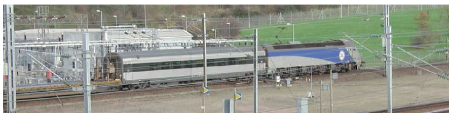
Fig. 5 Railway station of the Euro Tunnel