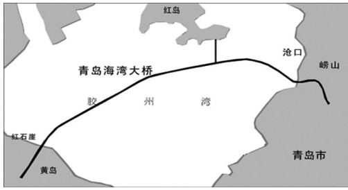
图 13 青岛胶州湾跨海大桥位置示意 Fig. 13 Schematic map of the Jiaozhou Bay Bridge