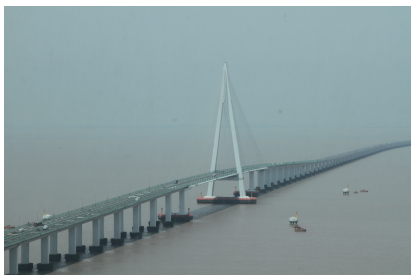
图 18 杭州湾跨海大桥实景 Fig. 18 Hangzhou Bay Bridge