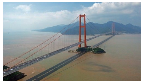
图 20 舟山大陆连岛工程实景(金塘大桥) Fig. 20 Zhoushan Mainland-Islands Links (Jintang Bridge)