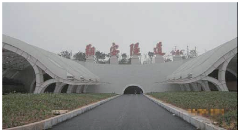
图22 厦门翔安海底隧道实景