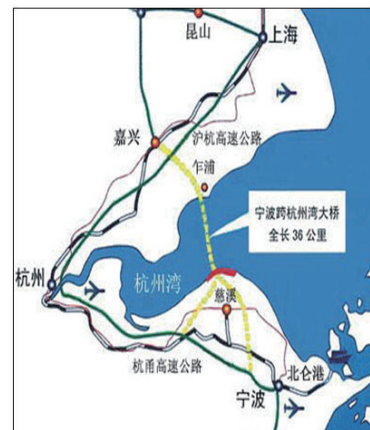
图 17 杭州湾跨海大桥位置示意 Fig. 17 Schematic map of the Hangzhou Bay Bridge