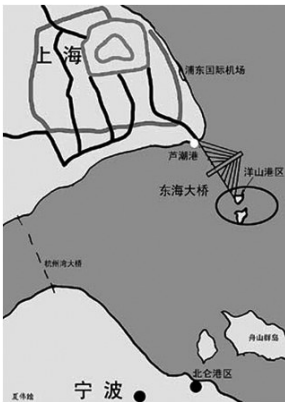
图 15 东海大桥位置示意 Fig. 15 Schematic map of the East Sea Bridge

舟山大陆连岛工程又称舟山跨海大桥,是国家高速公路网杭州湾地区环线高速公路联络线,起于舟山本岛,途经里钓、富翅、册子、金塘 4 岛,跨越 5 个水道和灰鳖洋,至宁波镇海登陆,与宁波绕城高速公路和杭州湾大桥相连接(图 19)。该工程跨 4 座岛屿,翻 9 个涵洞,穿 2 个隧道,全长 48 km,总投资 130 亿元,由岑港大桥、响礁门大桥、桃夭门大桥、西堠门大桥、金塘大桥 5 座跨海大桥及接线公路组成,是中国也是世界上规模最大的岛陆联络工程(图 20)。