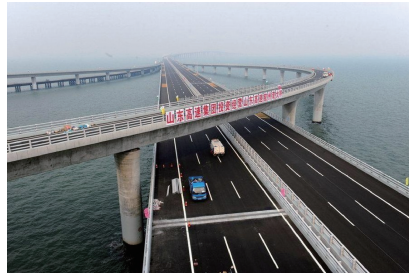
图 14 青岛胶州湾跨海大桥实景 Fig. 14 Jiaozhou Bay Bridge

上,已有的桥梁,主要是依长江、黄浦江、苏州河而建,而东海大桥是第一座外海大桥,也是中国第一座真正意义上的外海大桥。大桥总长 32.5 km,包括 2.3 km 的陆上段、海堤至大乌龟岛之间约 25.5 km 的海上段、大乌龟至小洋山岛之间约 3.5 km 的港桥连接段。2002 年 6 月 26 日正式开工建设,2005 年 5 月 25 日实现贯通。大桥宽 31.5 km,分上、下行双幅桥面,双向 6 车道。最大主通航孔,离海面净高达 40 m,相当于 10 层楼高,可满足万吨级货轮的通航要求(图 16)。大桥两侧 1000 m 以外沿