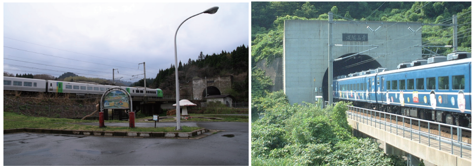
图8 青函隧道出入口