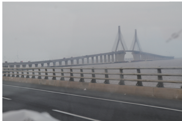
图 16 东海大桥实景 Fig. 16 East Sea Bridge