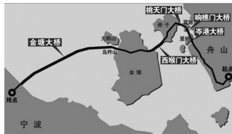
图 19 舟山大陆连岛工程线路示意 Fig. 19 Schematic map of the Zhoushan Mainland-Islands Links