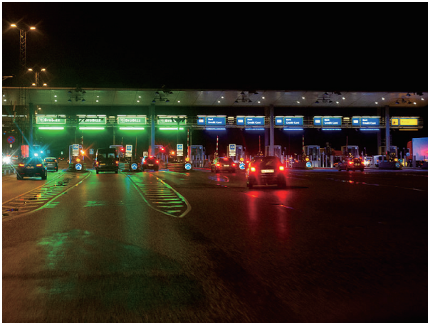
图 12 大贝尔特桥隧收费站(东桥)