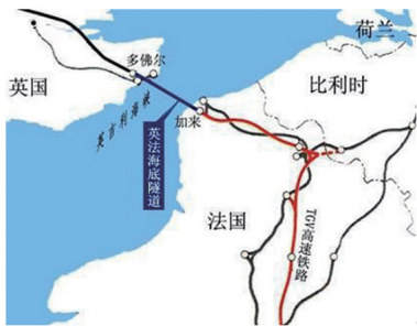
图2 英吉利海峡隧道位置示意 Fig. 2 Schematic map of the Euro Tunnel