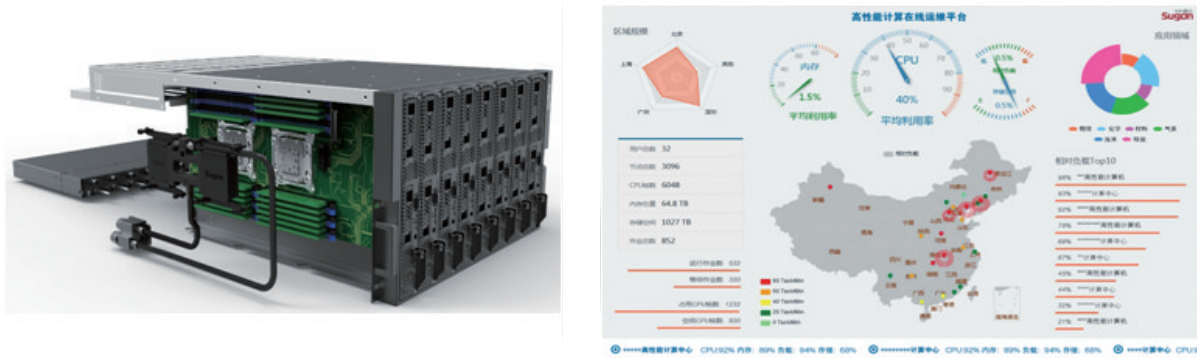
图2 曙光公司液冷产品 TC4600E-LP(a)和 EasyOP 在线运维平台(b)

机的运行功耗,另一方面也要尽量减少为高性能计算机散热而消耗的能量。曙光自2010年开始研究高性能计算机的液冷技术,在许多技术方面做出了创新,形成了新的技术体系,可大大减少散热致冷系统的能耗(图2(a))。同时,液冷技术还有助于降低传统风冷带来的巨大噪音,在进一步缩小机器尺寸的同时,使高性能计算机可以安静地在办公环境中工作。