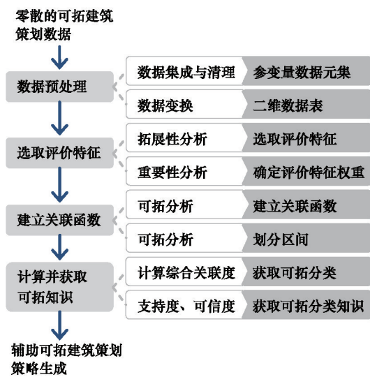
图1 参变量数据元集的可拓建筑策划分类知识挖掘流程

由此,将可拓分类知识挖掘方法的一般流程进行梳理,并结合可拓建筑策划数据形式各异、问题最优解不唯一的特性,建立针对参变量数据元集的可拓建筑策划分类知识挖掘流程(图1)。