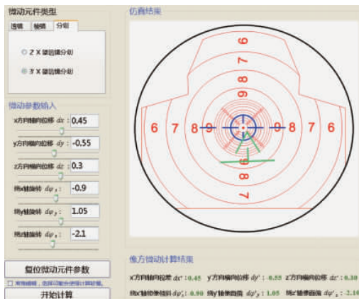
图4 3倍望远镜分划的平移和旋转微动量仿真