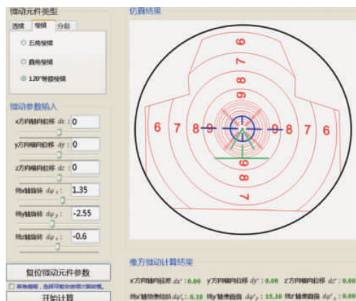
图3 120°等腰棱镜的旋转微动仿真