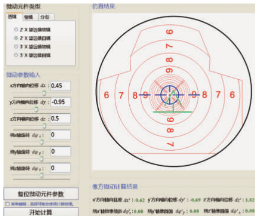
图2 2倍望远镜目镜的平移微动量仿真

分别对2倍望远镜目镜的平移微动量、120°等腰棱镜的旋转微动量和3倍望远镜分划的平移和旋转微动量所造成的像方微动进行仿真,仿真结果见图2、图3和图4。