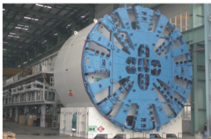
图 2 盾构机整体结构

在穿黄盾构施工实践中所采用盾构机的性能充分考虑了以上因素,为后续的掘进施工创造了良好的条件。所选盾构机整体结构如图 2 所示。