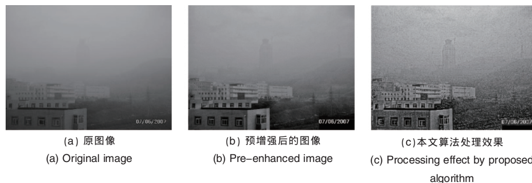
图 2 本文算法处理效果比较图