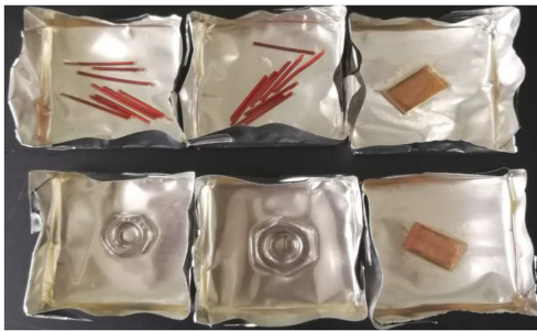
图2 TJ1173-1 固化后且经冷热冲击实验后的样品形貌