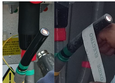
图1 江西某工程中压聚丙烯电缆去除半导体屏蔽 Fig.1 Removing the semiconducting shield of medium voltage polypropylene cable for a project in Jiangxi

XLPE电缆相比,聚丙烯电缆在制作接头时去除半导体层需要更长时间,如图1所示。为了确保供电质量、方便运维工作,开发适用于聚丙烯电缆的新型环保可剥离半导体屏蔽材料十分重要。根据江西某10 kV丙烯基电缆工程建设经验,梳理了丙烯基电缆研制亟需解决的关键问题及研制目标,如表2所示。