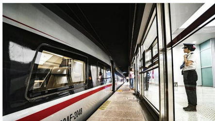
图1 京雄城际退台安装站台门

目前,能够适应多车型的站台门系统主要在国铁及国外一些互联互通线路上有一定的应用。国内主要调研了北京、深圳、郑州、成都等城市(见图1),国外对日本大阪进行了详尽考察研究(见图2)。根据目前调研结果,适应多种车型站台门已有多种解决方案,包括退台安装站台门、升降式站台门、套叠式站台门以及自适应站台门4种典型形式(见表3),从解决思路上来说,通常以退台、增大开度或增加开门区域这3种方式为主。