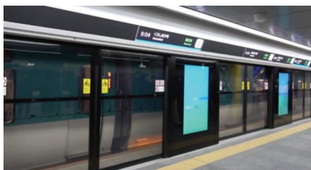
图2 JR梅北(大阪)站站台门

Figure 1 Installation of platform screen doors at stations along Beijing-Xiongan intercity railway during platform retreat