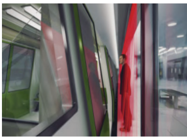
图 5 激光雷达探测

铁路跨线运行后,为满足铁路限界要求,限界需满足 1 850 mm,相比于轨道交通 1 780 mm 的限界要求加大了 70 mm,因此造成站台门与车车间的缝隙会更大。自适应站台门开门位置不一致,无法简单套用常规站台门间隙探测方式,因此间隙探测技术的选用也较为关键 [7] 。采用激光雷达探测方式(见图 5),激光雷达采用沿滑动门上方门机梁均匀布置安装方式,对滑动门覆盖区域进行全覆盖探测,相比传统的红外激光检测方式,激光雷达方式可实现空间检测,具有检测距离远、探测位置精确、可靠性高等优点 [8] 。