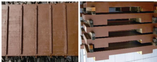
图2 高横向阻力的合成轨枕结构 Figure 2 Structure of synthetic sleepers with high lateral resistance

合成轨枕密度约为 0.74\text{ g/cm}^3 ,仅为混凝土轨枕的1/4,并低于普通木枕(约 0.8\sim 1.0\text{ g/cm}^3 ),在使用初期,特别是有砟道床道岔和小半径曲线路段,曾出现道床横向阻力不足的问题。但结合现场使用工况,轨道设计师和合成轨枕研制人员通过增加防滑块、地锚拉杆、底部防滑、侧面防滑、预弯钢轨等措施,有效解决了合成轨枕道床横向阻力不足的问题 [8,13,28] ,如图2所示。底面或侧面增加防滑结构,可提升横向阻力近20% [28] 。