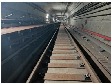
图1 合成轨枕在厦门地铁3号线整体道床的应用 Figure 1 Application of synthetic sleepers in the ballastless track of Xiamen Metro Line 3

金属管路发生电化学腐蚀,因此选择绝缘性好的合成轨枕 [12] ,具有良好的杂散电流防治效果。2019年,在厦门地铁3号线翔安跨海隧道段,为避免海水渗透造成杂散电流过大问题,使用了合成轨枕。目前应用多年,效果良好,如图1所示。