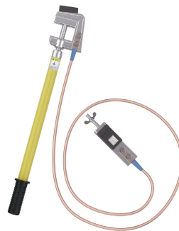
图3 接地线智能化改造效果

文献[31]提出一种带电报警型接地线,能够在带电设备安全距离外发出报警信号。本文对接地线进行智能物联改造,在接地线与接地桩卡接部分增加智能监测装置,智能监测装置具备接地线状态监测,以及物联通信、蓝牙通信和语音播报功能;在接地线与导线挂接部分增加智能验电装置,智能验电装置具备带电检测和声光报警功能。接地线智能化改造效果如图3所示。