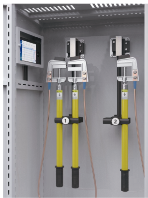
图2 接地线柜智能化改造效果

对接地线柜的智能化改造如下:增加接地线管理装置,装置具备无线通信模块;接地线柜增加接地线自动开闭锁装置,实现接地线的按票取用与归还。接地线柜智能化改造效果如图2所示。