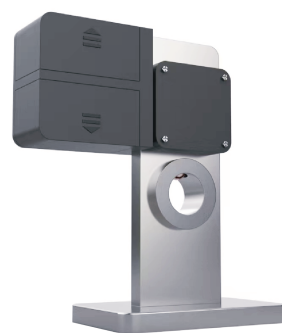
图 4 接地桩智能化改造效果

卡接后, 接地线智能监测装置接收接地桩唯一编码, 然后将自身唯一编码和接地桩唯一编码发送