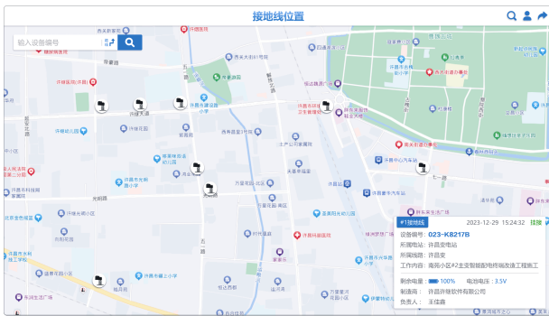
图 7 接地线地理信息及实时状态信息展示效果

互联网区的运维统计类应用，可以在 PC 端、运维大屏端展示接地线的实时状态、告警预警、统计分析和接地线的地理信息布局。现场运检人员可以直观地发现异常接地线，并及时进行处理。PC 端接地线地理信息及实时状态信息展示效果如图 7 所示。