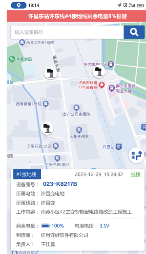
图 8 移动 APP 应用效果

以全天候掌握接地线的状态，并在第一时间对异常进行处理，有效保证了电网的安全稳定运行。移动 APP 应用效果如图 8 所示。