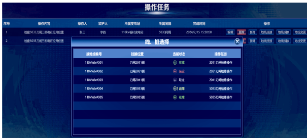
图 6 接地线挂接管理应用效果

互联网区的运维统计类应用，可以在 PC 端、运维大屏端展示接地线的实时状态、告警预警、统计分析和接地线的地理信息布局。现场运检人员可以直观地发现异常接地线，并及时进行处理。PC 端接地线地理信息及实时状态信息展示效果如图 7 所示。