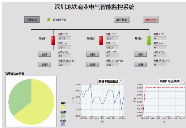
图4 地铁商业电气智能监控系统功能界面

通过实时获取链路商户的进线电压、电流、功率、电量等数据及进线开关状态,远程监测每个商户的用电情况,并实现远程抄表、商户开关遥控等