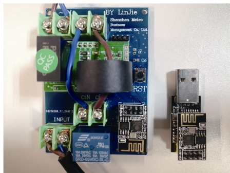
图 1 电气数据采集传输模块实物

“高度集成”是节约空间、提升效率的有效方式。选用集成底层驱动力的模块成品，利用芯片封装模组及软件编程的方式开发产品功能，使硬件设计更简约，生产成本更低廉。比如，本系统选用自带 ModBus-RTU 协议的电气采集模块，无需对底层规约二次开发；WiFi 选用支持 AT（Attention）精简指令集的模块，确保报文高效传输。此外，上位机与数据服务器集成开发，将数据存储、计算、显示等功能一体化，节约设备成本，减少空间占用。本文开发的电气数据采集传输模块实物如图 1 所示。