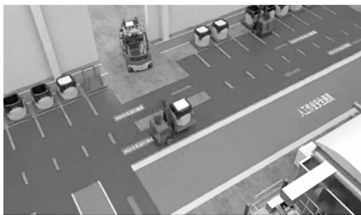
图4 基于计算机虚拟仿真的生产节奏模拟图

(2) 稀土氧化物生产线生产流程虚拟现实仿真。智能化生产作业现场对于各生产设施设备的协作配合程度以及设施设备的作业工序时间有着较高的要求。为了能够清楚地了解到改造后能否满足智能化作业流程及达到预期的效果,通过采用虚拟仿真技术,根据现场生产实际环境及相关设备搭建虚拟环境,将所涉及的生产设备的协同运行过程,以实际生产运行数据为基础在虚拟环境中进行模拟仿真,对产品包装与运输的节拍进行可行性论证,剖析存在问题,以模拟数据对生产节奏进一步优化,从而保证稀土产品生产线智能集成制造系统生产流程、运输设备运行节拍达到最优。图4为基于计算机仿真的生产节奏模拟图。