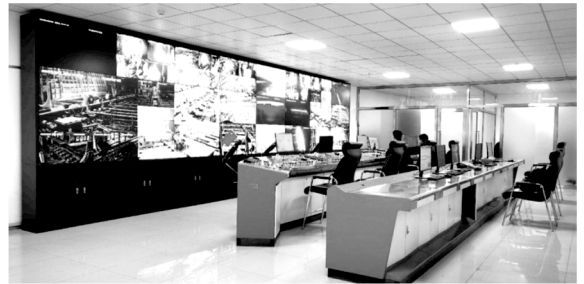
图 2 智能集控中心

(3) 监控与控制模块。提供直观的监控界面,实时显示加热炉的运行状态、关键参数以及设备布局。操作人员可通过该模块远程控制加热炉的燃烧系统、温度调节系统等设备,根据生产要求调整运行参数。同时,系统具备报警功能。当监测到异常数据或设备故障时,及时发出声光报警,并推送报警信息至相关人员。图 2 为智能集控中心。